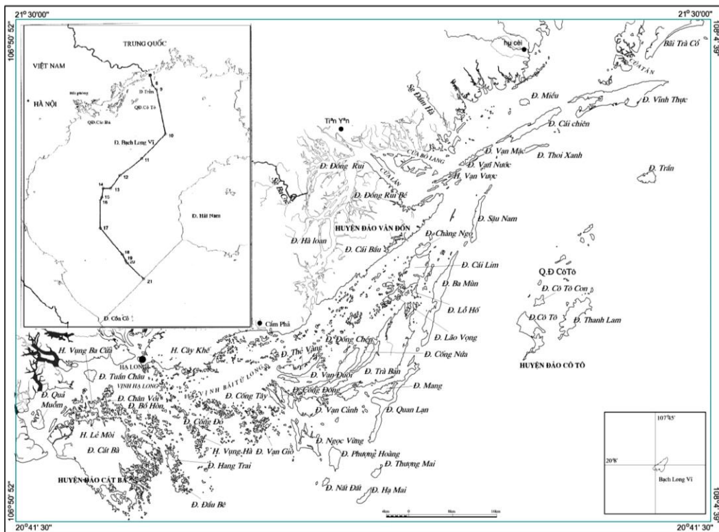
Hình 1. Sơ đồ vị trí 50 đảo ven bờ Bắc Bộ (có diện tích từ > 1 km 2 )